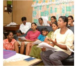
„Un nuevo modo de ser Iglesia“, PID Malaysia/Singapur 2004

múltiples sugerencias para la Pastoral en Alemania, tanto en el este como en el oeste. En la última edición de „KM Forum Weltkirche“ septiembre/octubre 2004, se hizo una compilación de experiencias del PID y de evaluaciones importantes sobre la situación de la Iglesia y de las Pastorales en Malasia y Singapur.