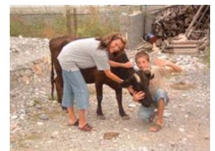
„Pobreza y migración“ PID Albania 2004

sino agradecimiento de ser tomados en cuenta como seres humanos y europeos. „Los albaneses son diferentes!“ a los prejuicios en nuestras cabezas. Los encuentros y el diálogo intensificaron la colaboración entre Renovabis y las iglesias locales. Mas allá de ello, se hizo evidente para los participantes del PID, por qué y con que objetivos trabajan solidariamente para y con las personas en Europa del este