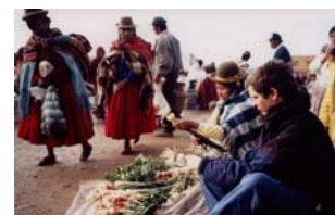
C. Sigrist, KfW, con la anfitriona en el mercado, PID Bolivia 2001

B. Wenn, Director del Banco para la Reconstrucción (KfW), Jefe de la Secretaría de Exteriores, extracto de la carta del 07/04