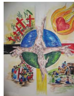
Cruz maya El Quiché/Guatemala

Finalmente se intentó definir campos concretos de experiencia en los países del sur y en Europa del este, que desde el punto de vista de las organizaciones eclesiológicas participantes, sean adecuadas para las experiencias de aprendizaje espirituales, pastorales y eclesiológico-mundiales. Los resultados del taller serán documentados y pueden ser solicitados a la Asociación PID.