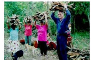
Distancias desiguales: „Poresaqui no está lejos de Santa Cruz, Santa Cruz por el contrario, está infinitamente lejos de Poresaqui.“

de diferentes ciudades bolivianas, el prefecto interino de Santa Cruz, así como altos ejecutivos de federaciones de empresarios, ganaderos y terratenientes. En base a las experiencias positivas con el PID, CEPROLAI va a organizar su propia estructura de trabajo para la realización de PIDs para ejecutivos locales sobre el tema „good governance“.