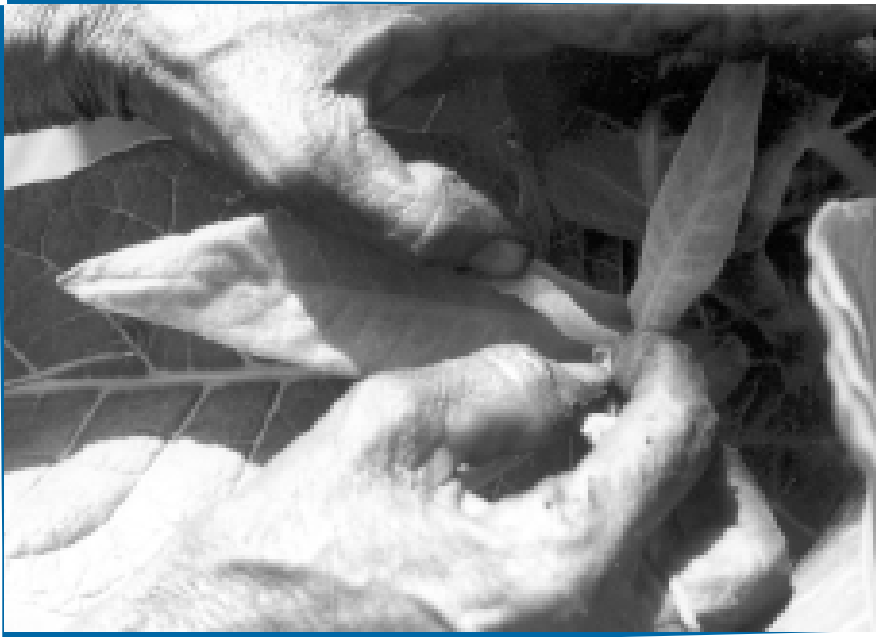
Die Hände von Paniben, einer Tabakarbeiterin, die bis zu ihrem Tod im Vorstand ihrer Gewerkschaft vertreten war

Das Exposure- und Dialogprogramm strebt über die entwicklungs- bzw. wirtschafts- und gesellschaftspolitischen Ziele in den Ländern der sogenannten Dritten Welt hinaus auch eine gesellschaftspolitische Wirkung in der Bundesrepublik an. Die unmittelbare Begegnung der Besucher aus dem Norden mit den Akteuren erfolgreicher Selbsthilfe im Süden kann die Handlungskompetenz der Besucher stärken und sie motivieren, konstruktive Beiträge zur Lösung unserer eigenen gesellschaftlichen Probleme zu leisten.