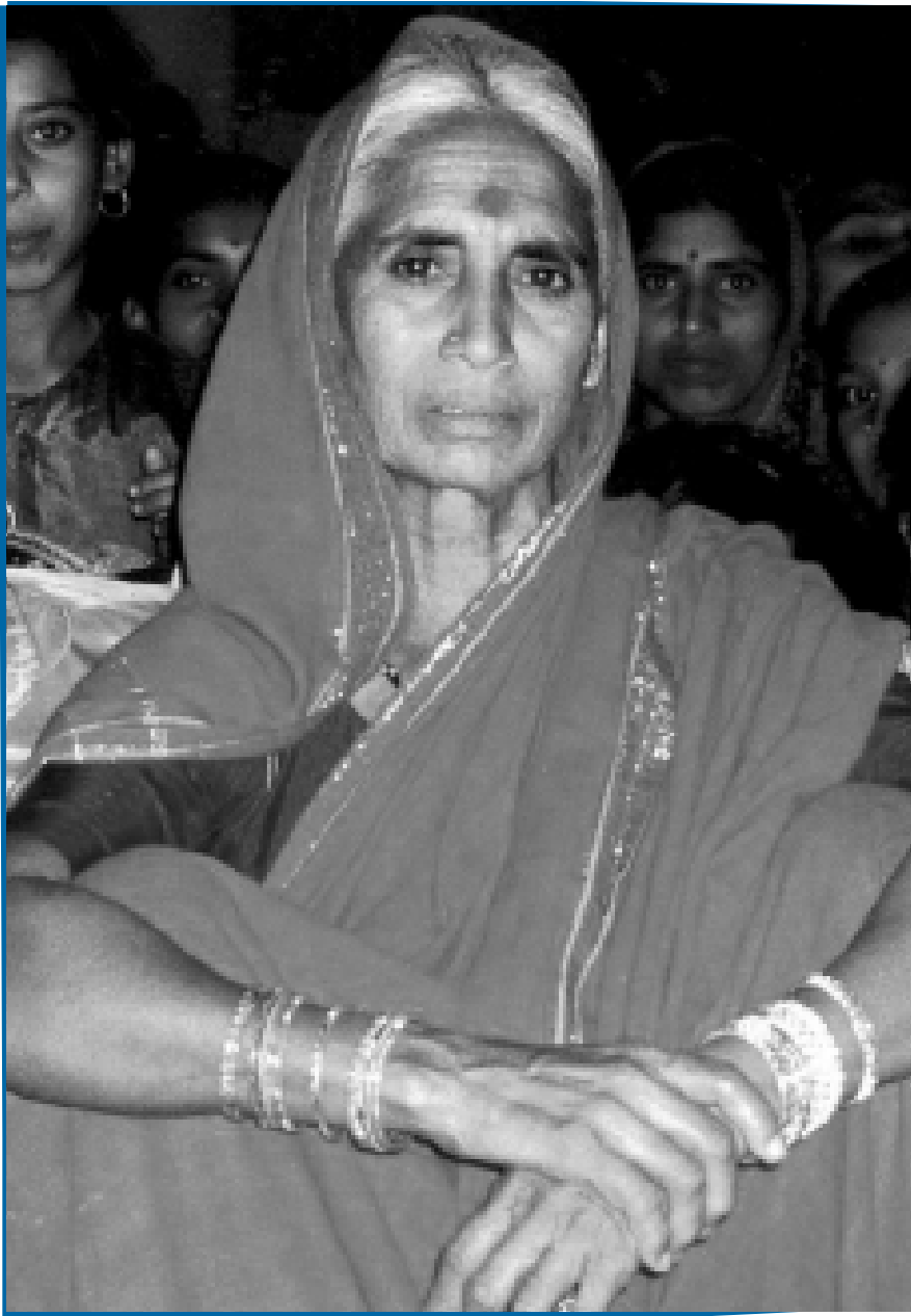
Entwicklung bekommt ein Gesicht Paniben, Indien